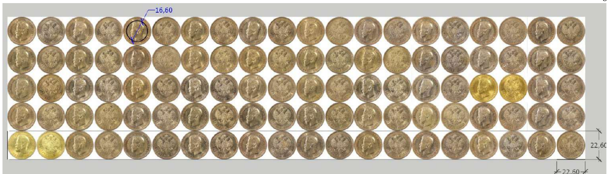
Признак реверса Р2