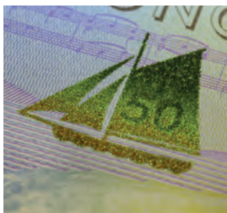
Банкнота 50 крон Лодка