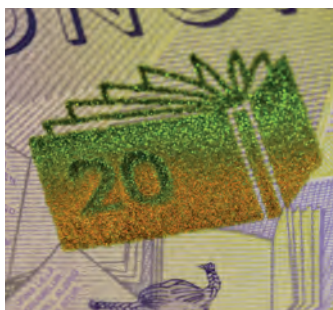
Банкнота 20 крон Книга

На новых банкнотах также имеется меняющее цвет изображение, которое имеет отношение к изображенному на портрете человеку. На этом изображении также указан номинал банкноты. Изображение и обозначение номинала плавно меняют цвет от золотого к зеленому при наклоне банкноты. Изображение располагается справа от портрета на лицевой стороне банкноты.