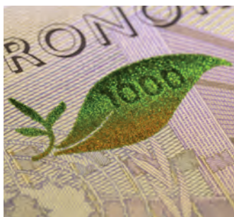
Банкнота 1 000 крон Оливковая ветвь

Банкноты также имеют ряд других признаков подлинности. Информация о них находится на сайте Riksbank: