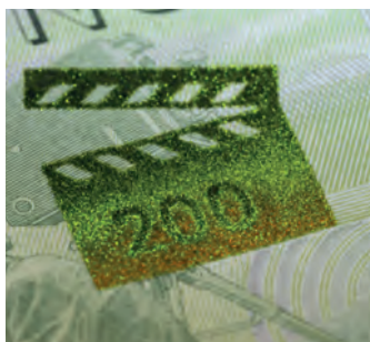
Банкнота 200 крон «Хлопушка» для кино