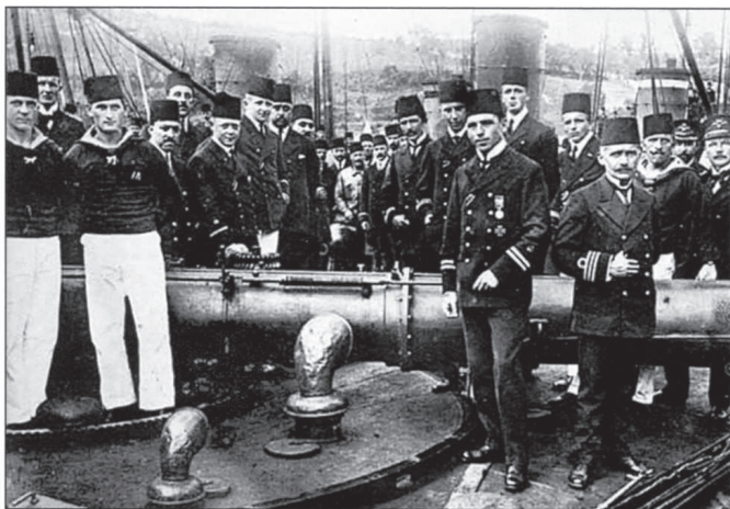
Торпедисты и офицеры эсминца «Муавенет» позируют вокруг торпедного аппарата «победившего Голиафа»