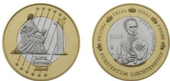
Один из вариантов так называемого «фантазийного евро», имитирующий 1 евро Лихтенштейна

В последующие годы производство монетовидных изделий, получивших название «фантазийные евро», достигло такого размаха, что власти Европейского союза вынуждены были наложить законодательные ограничения на их производство. В частности, на подобных изделиях запрещено использовать номинал, выраженный в «Euro» или «Euro Cent», а также, для предотвращения их использования в платёжных автоматах, технические характеристики таких изделий (масса, диаметр) не должны соответствовать реальным монетам евро.