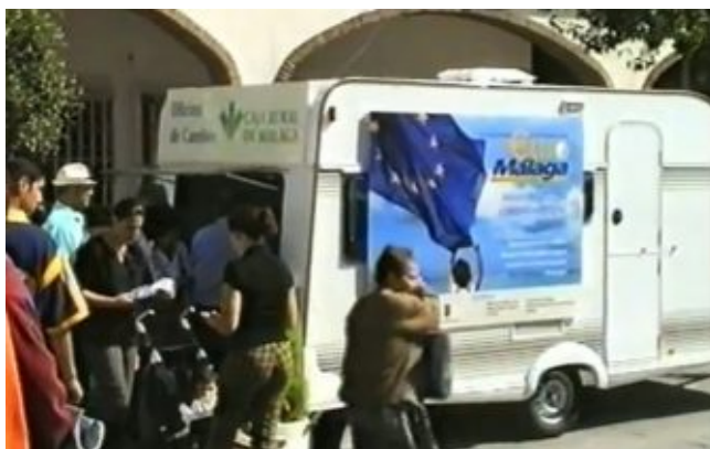
Один из передвижных обменных пунктов

В местных отделениях банков и почтовых отделениях района были открыты специальные обменные пункты, в которых можно было обменять песеты на жетоны. Также в Чурриане работали передвижные обменные пункты. Курс обмена был установлен на уровне фактического обменного курса национальной валюты к евро и составлял 166,386 испанской песеты за 1 евро.