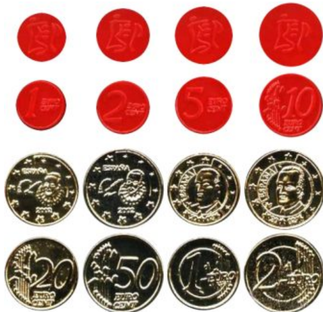
Комплект жетонов, выпущенный по инициативе испанского учебного центра IES «Pascual Calbó i Caldés» (о. Менорка) в ноябре 1998 г. Жетоны изготовлены из металла жёлтого цвета и красного пластика местным предприятием «ITUTCO», специализирующемся на выпуске бижутерии.

Однако, наряду с официальными программами, санкционированными государственными структурами, в период, предшествовавший введению евро в обращение, аналогичные акции осуществлялись и по инициативе частных лиц и неправительственных организаций. Выпускавшиеся ими жетоны изготавливались из самых различных материалов на частных предприятиях в небольших объемах.