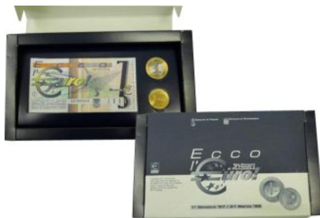
Наборы бон и жетонов проекта «Ессо l'Euro», выпущенные фирмой «Messaggeri dell'Arte» в 1997 году

Рыночная стоимость таких наборов на сегодняшний день составляет 35-40 евро и 65-70 евро, соответственно. Стоимость жетонов: 50 евроцентов - 10 евро, 1 евро - 12-15 евро.