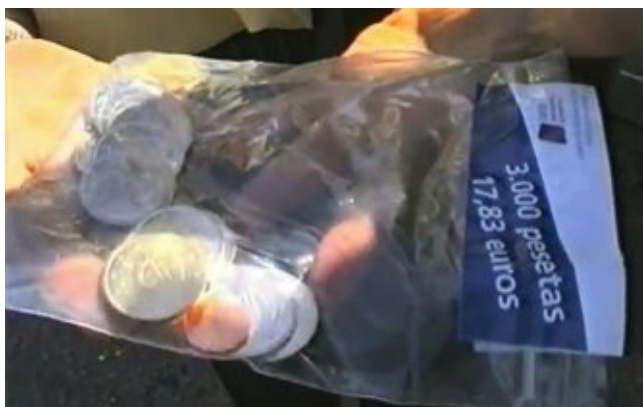
Набор «евро», выдававшихся в обменных пунктах Чуррианы

Для реализации проекта монетным двором Испании были отчеканены жетоны достоинством 2 и 1 евро, 50, 20, 10, 5, 2 и 1 евроцентов.