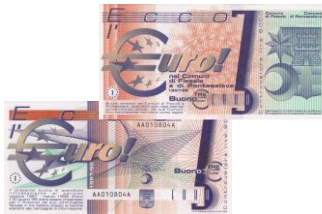
Бона 3 евро для проекта «Ессо l'Euro», 135 x 70 мм, тираж - 200 000 шт.

Для удобства жителей и гостей городов Фьезоле и Понтассьево во всех магазинах и учреждениях, принявших участие в проекте, использовались ценники выраженные в двух валютах: итальянских лирах и евро.