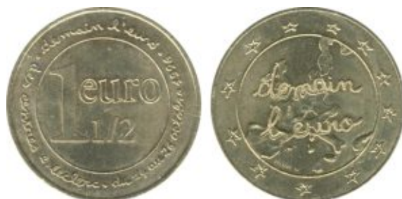
Жетон достоинством 1,5 евро, выпущенный сетью французских супермаркетов «E. Leclerc» в октябре 1996 г. Жетон изготовлен из бронзы на монетном дворе Франции.

Несмотря на то, что целью таких акций официально объявлялась адаптация населения к новой валюте, фактически они являлись не более чем рекламными акциями с целью привлечения покупателей (туристов и других клиентов, в зависимости от профиля организации, проводившей акцию).