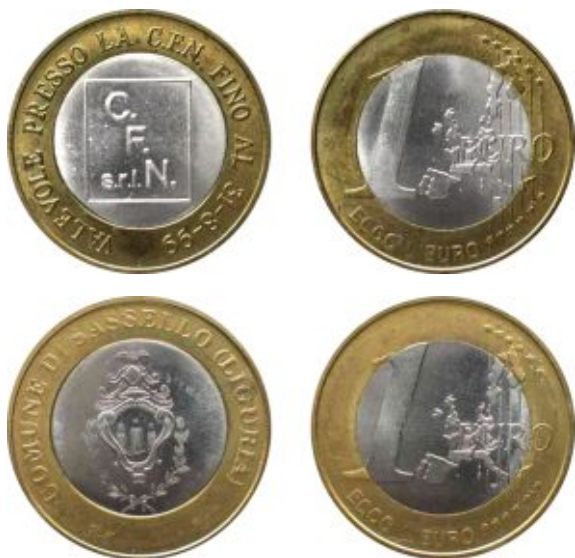
Монетовидные изделия «1 евро», спекулирующие на теме проекта «Ессо l'Euro!» и утвержденном дизайне общей стороны монет евро. Изготовлены на частном монетном дворе Италии «I.M. International Mint S.R.L.».

После того, как в июне 1997 года состоялось официальное представление дизайна общей стороны будущих монет евро, выполненного бельгийским художником Люком Люиксом, в процесс изготовления монетовидных изделий, повторяющих дизайн монет евро, активно включились частные монетные дворы и прочие фирмы, специализирующиеся на изготовлении жетонов и других подобных изделий.